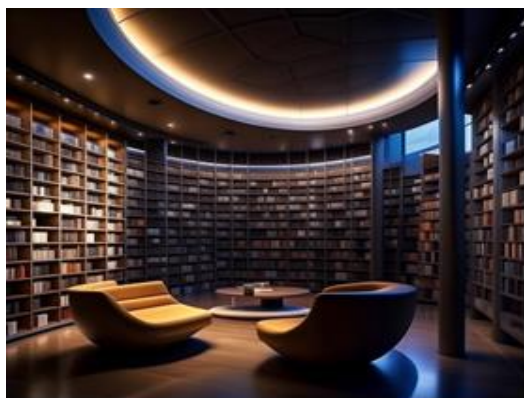
Дизайн современной библиотеки