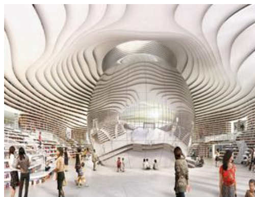
Библиотека Биньхай Тяньцзинь. Китай