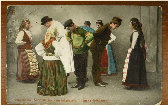
Klappdansen. Suomalaisia kansantansseja. Finska folkdanser.